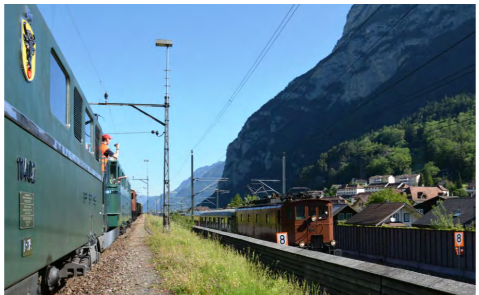
Begrüßungs-Parade für den Extrazug im Urnerland.