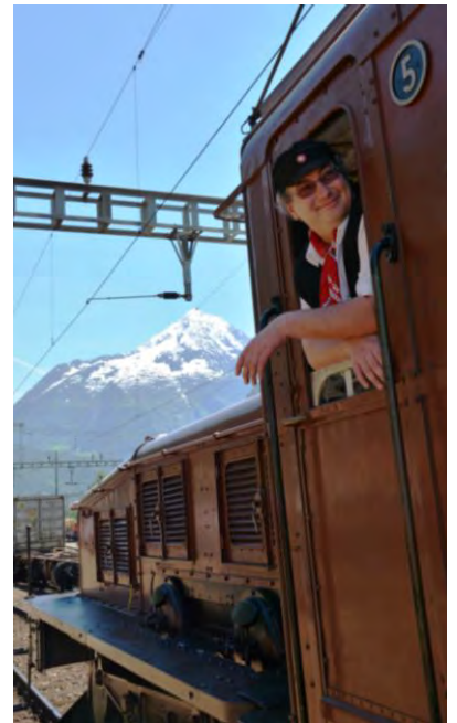
Lauter fröhliche Gesichter.