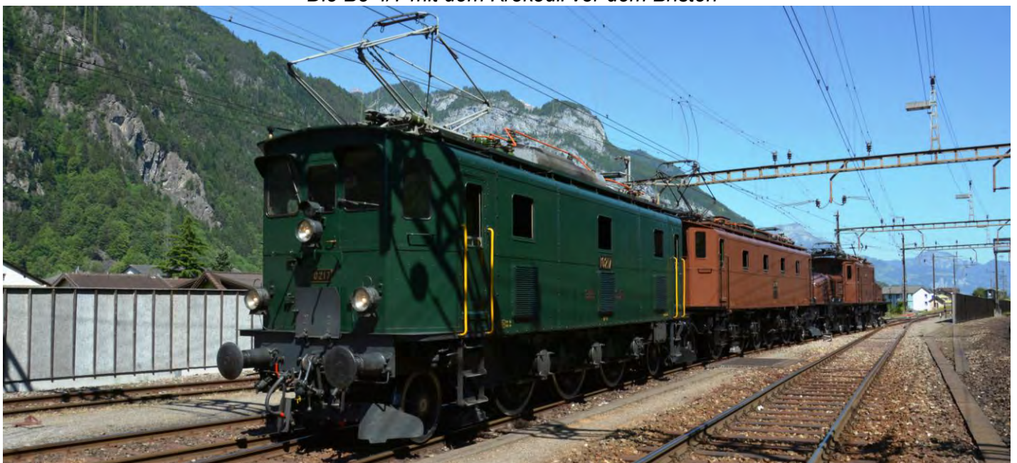
Der Ausflug der alten Damen.