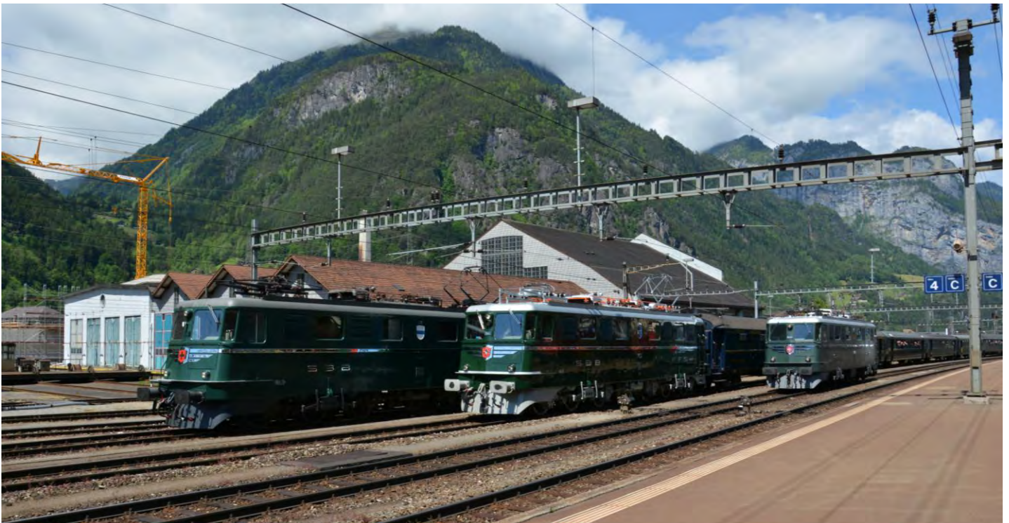
Dreimal Ae 6/6: Die 11407 „AARGAU“ durchfährt in der Mitte bei Ihrer zweiten Jungfahrt die Spalier stehenden 11411 „ZUG“ und 11402 „URI“.