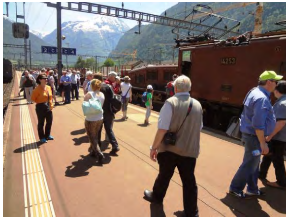
Volksfeststimmung auf dem Perron in Erstfeld.