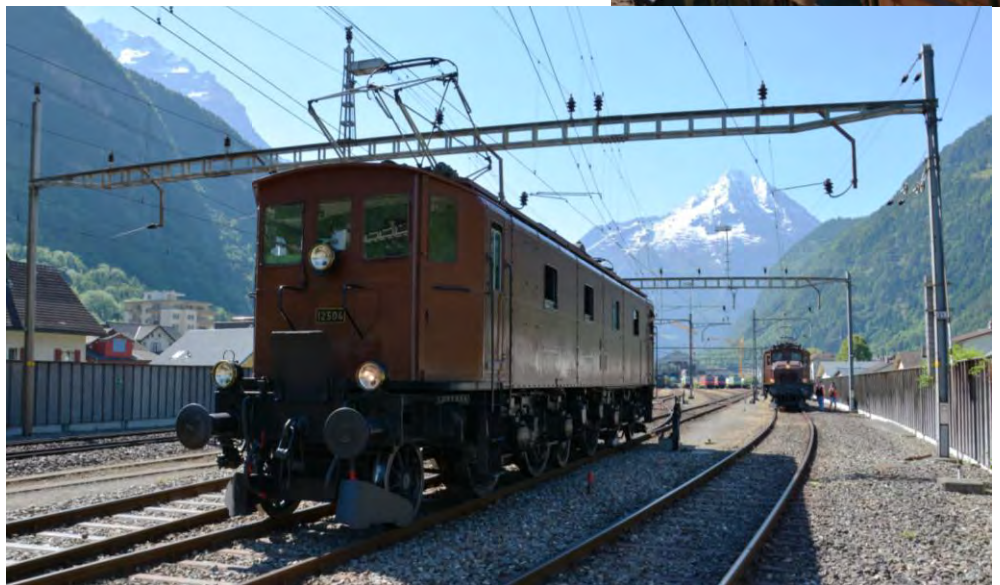
Die Be 4/7 mit dem Krokodil vor dem Bristen