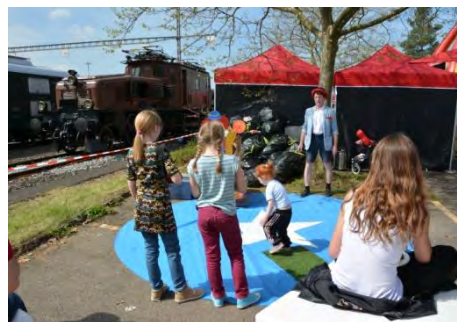
Spielplatz mit Krokodil!