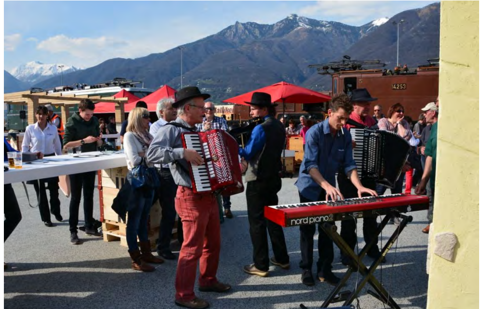
Das Krokodil und der Uristier als Kulisse für das „Tessiner Musikfest“ in Cadenazzo.

Am Samstag 29. März 2014 organisierte die SBB Cargo für Ihr Personal im Tessin einen Festanlass in Cadenazzo. Anwesend an der Fahrzeugausstellung waren aus Erstfeld die Ae 6/6 11402 „Uristier“ und die Ce 6/8 II „Krokodil“. Mit viel südländischem Flair und Stimmung wurden die guten Zahlen der SBB Cargo gefeiert.