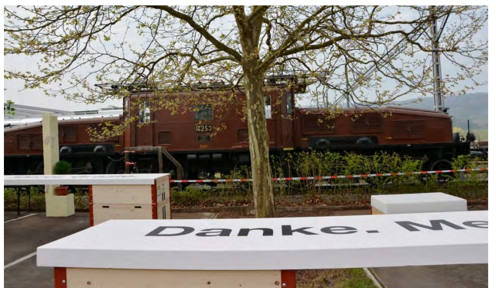
Ein Danke an die Mitarbeiterinnen und Mitarbeiter mit der Ce 6/8 II als Kulisse.