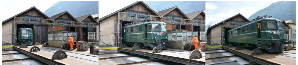
Der „inoffizielle“ Rollout fand schon am Freitag, 04. April 2014 statt. Die Ae 6/6 „ZUG“ wurde von der Dampremise ins Depot überführt.