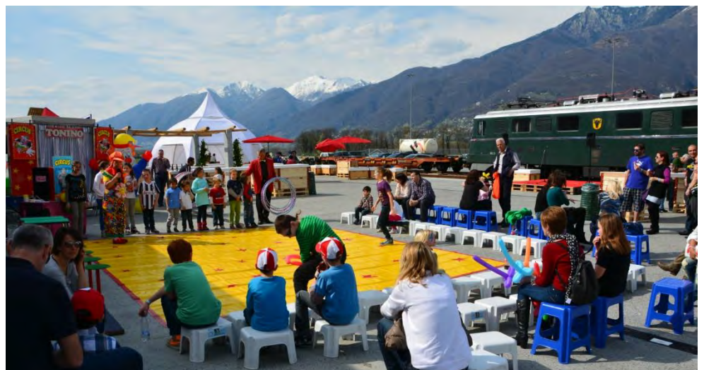
Kinderzirkus vor der Ae 6/6 11402