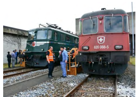
Die herausgeputzte Ae 6/6 11411 „ZUG“ neben der Re 6/6 bzw. Re 620 088.