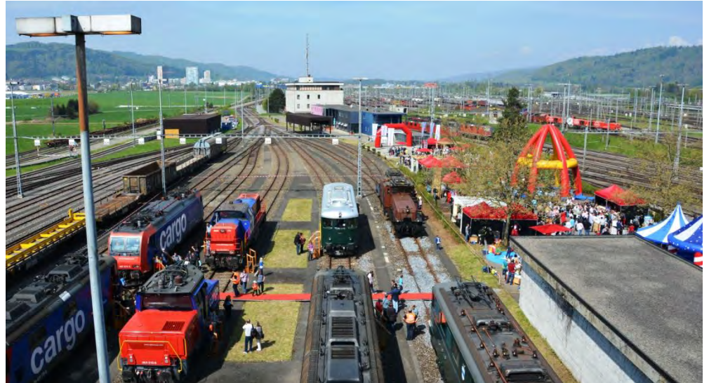
Übersicht auf die Fahrzeugausstellung und das Festgelände am RBL.

Der gleiche Anlass wie in Cadenazzo fand am Samstag, 12. April 2014 für die deutschschweizer Mitarbeiter der SBB Cargo am Rangierbahnhof Limmattal (RBL) statt. Rund 1300 Mitarbeiter besuchten den kurzweiligen Anlass. Das SBB Historic Team Erstfeld war erneut mit dem Krokodil und der „neuen“ Ae 6/6 11411 „ZUG“ anwesend.