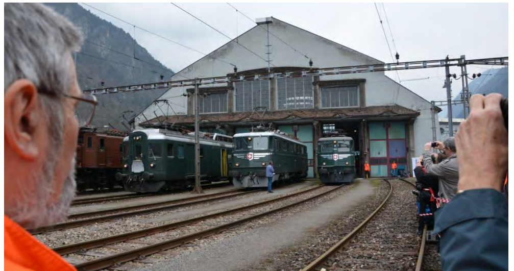
Der offizielle Rollout der Ae 6/6 11411 „ZUG“, am Samstag 05. April 2014 kurz nach 14.00 h aus dem Depot in Erstfeld.